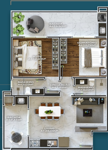
APTO TIPO 105/205/305 ÁREA PRIVATIVA = 82,67M 2