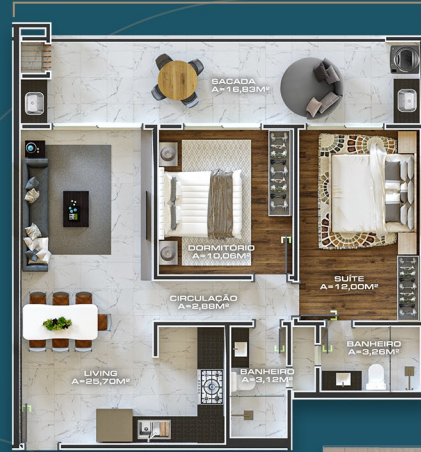
APTO TIPO 106/206/306 ÁREA PRIVATIVA = 83,81M 2