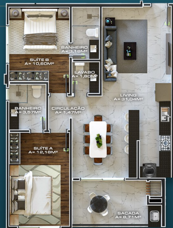
APTO TIPO 104/204/304 ÁREA PRIVATIVA = 81,40M 2