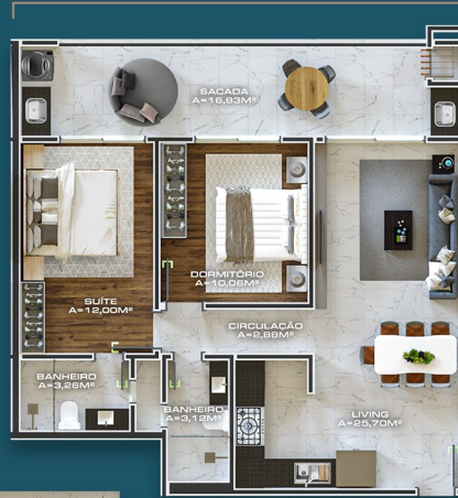
APTO TIPO 107/207/307 ÁREA PRIVATIVA = 83,81M 2