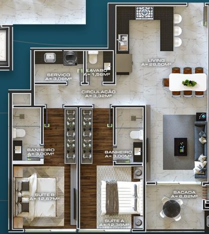
APTO TIPO 102/202/302 ÁREA PRIVATIVA = 84,93M 2