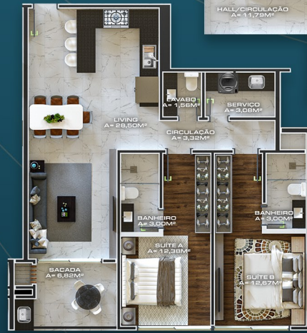
APTO TIPO 103/203/303 ÁREA PRIVATIVA = 84,93M 2