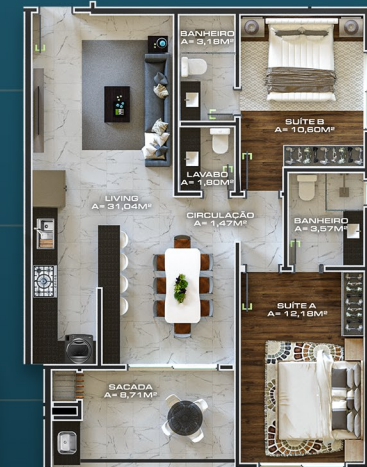
APTO TIPO 101/201/301 ÁREA PRIVATIVA = 81,66M 2